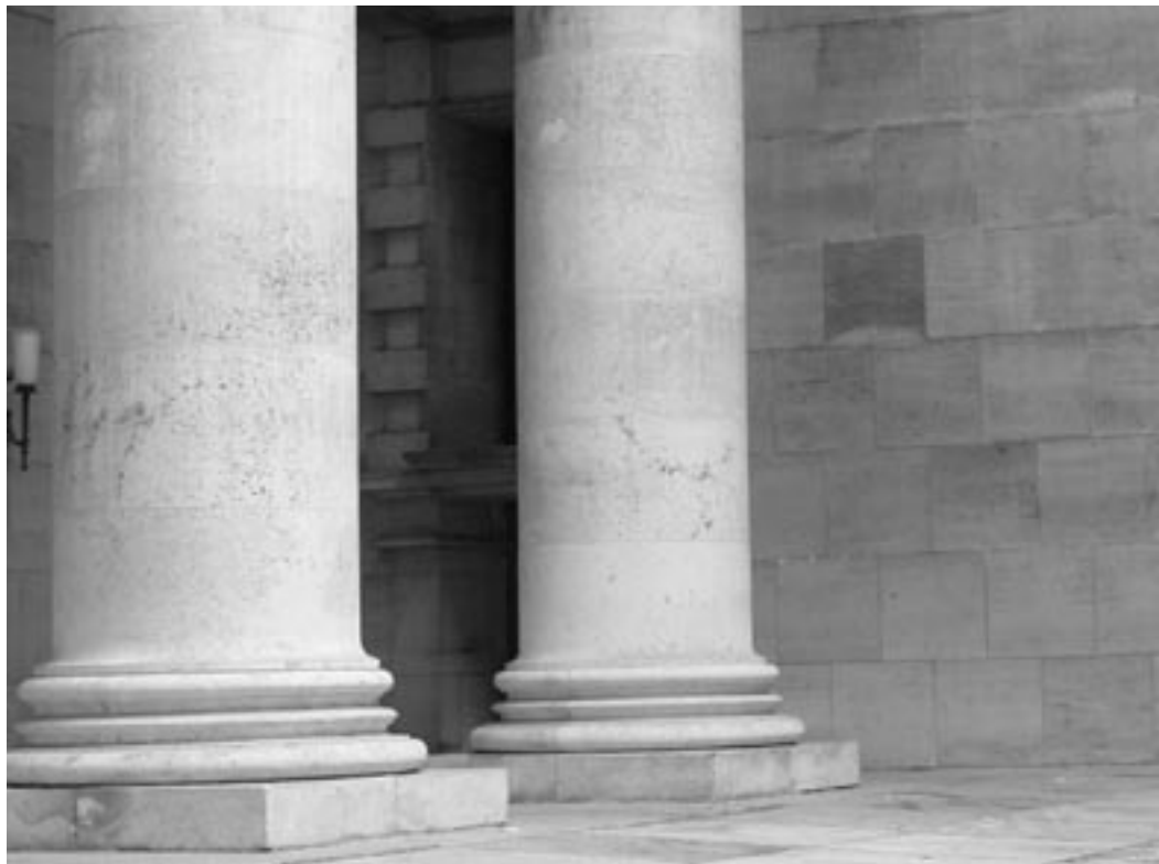
I Mindegårdens central niche står kunstneren Einer Utzon-Franks

rindeligt de 24 stole, hvoraf 22 i dag er opstillet i forhallen.