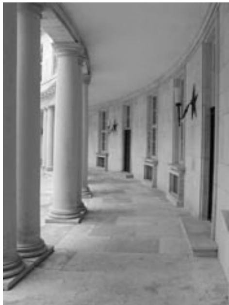
Den Runde Gård, kolonnadens bagvæg