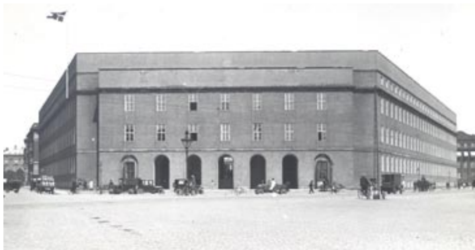
Politigården fotograferet fra Polititorvet i slutningen af 1920'erne

Politigårdens eneste ydre udsmykning findes