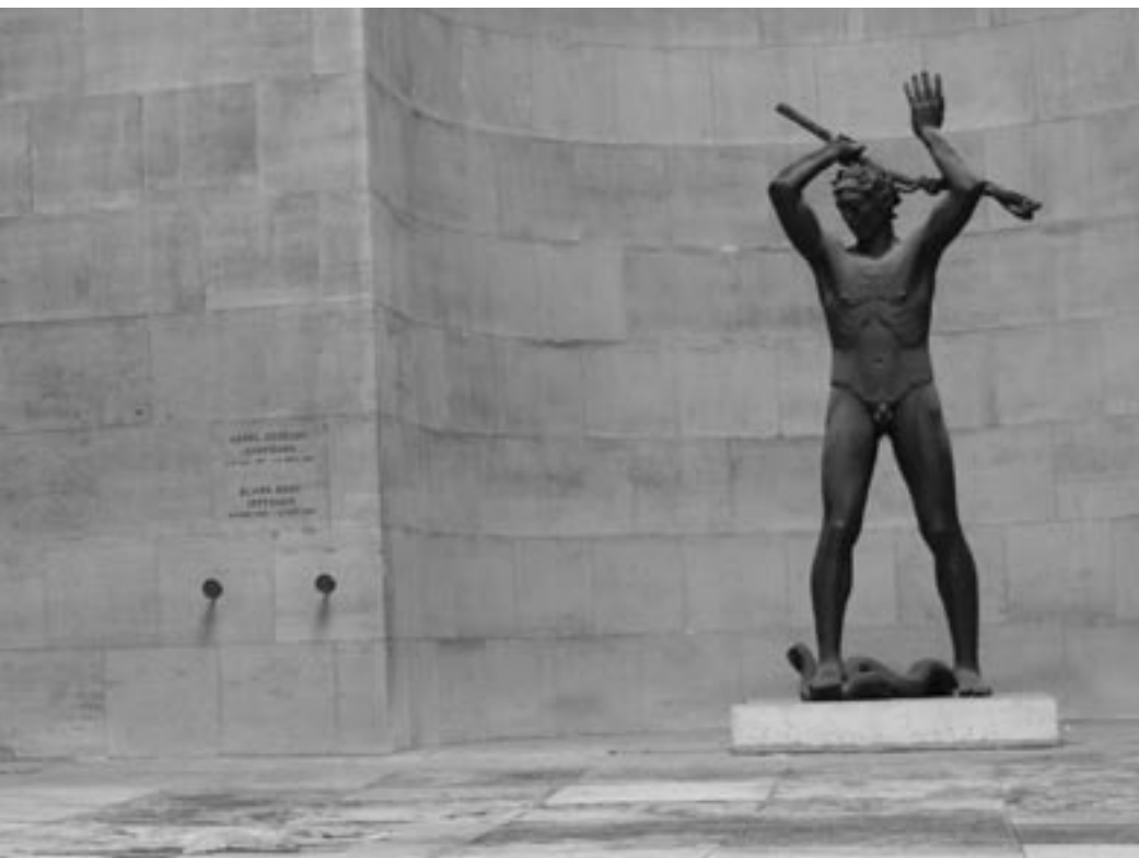
bronzestatue "Slangedræberen", der blev købt til stedet i 1925

er sparsommeligt oplyst, og arkitekten har derved opnået, at den firkantede gård virker mere overvældende, når man træder ud i den fra trapperummet.