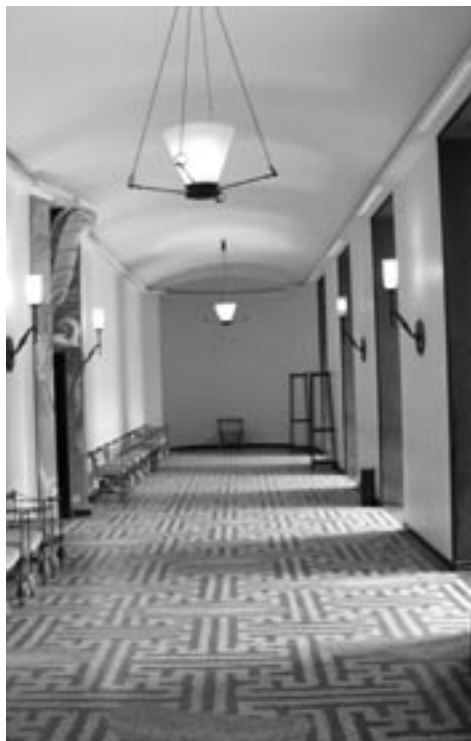
Forhallen ved politidirektørens kontor og Parolensalen

Man har med rette sagt om Politigården, at Mdens indre er som en labyrint . Rotundernes udformning – på opførelsestidspunktet var der ikke nogen identifikationer på, hvad der gemte sig bag de enkelte døre – gør, at selv stedkendte medarbejdere må standse op for at orientere sig. Politigården indeholder en mængde buede og lige gange af forskellig længde. Den længste, lige gang løber mellem de to runde, åbne trapperum – langs med Otto Mønstedts Gade – og har en længde på over 100 meter. For at bryde monotonien har gangene fået individuelt præg i form af forskellig/varieret farve, der er påført blændingerne rundt om dørene og vinduesindfatninger. Der er dog ikke tale om en systematisk farveplan, der gør orienteringen i bygningen lettere.